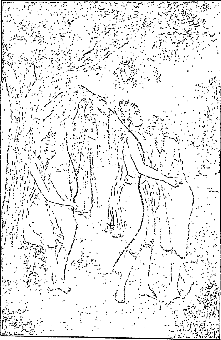
भरत का श्रीरामचन्द्रजी से मिलाप